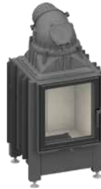
Lina 45 mit schwenkbarer Front