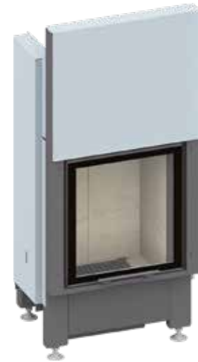
Lina GT 45 mit hochschiebbarer Front