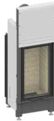
Lina 4580 mit hochschiebbarer Front