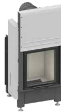
Lina 45 mit hochschiebbarer Front